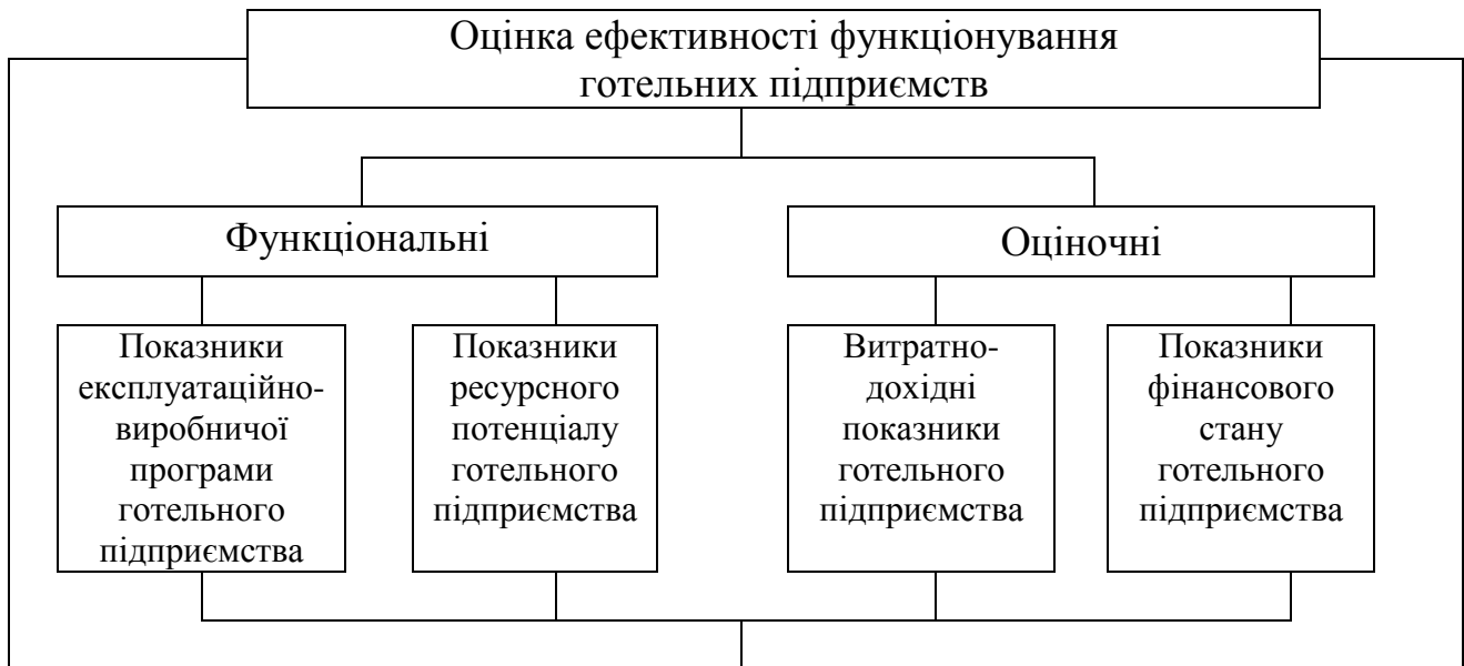
Рис. 1. Схема групвання показників щодо оцінки ефективності функціонування готельних підприємств за критеріальними напрямками

Показники «витратно-дохідної частини діяльності готельного підприємства» характеризують ефективність використання витрат та оцінюють отриманий результат. Запропоновано доповнити даний критеріальний напрям показником «ефект виробничого левериджу», що надає можливість оцінити структуру (співвідношення) постійних та змінних витрат підприємства.