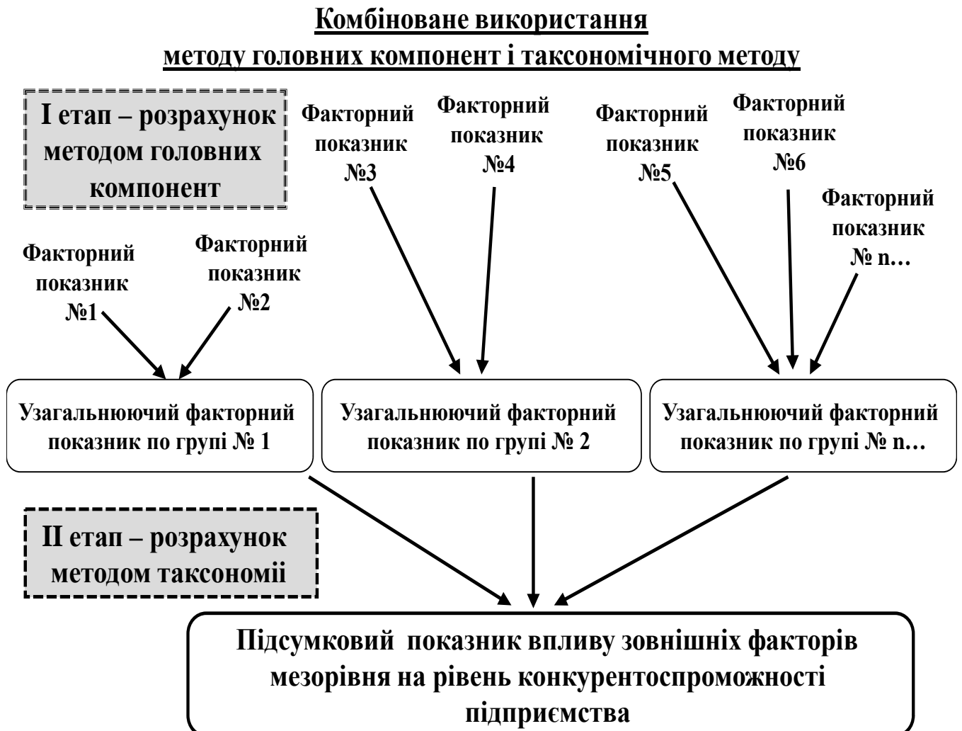
Рис. 2 Схема комбінованого, послідовного використання методів багатовимірного статистичного аналізу для оцінки впливу зовнішніх факторів конкурентоспроможності підприємств

Схема комбінованого, послідовного використання методів багатовимірного статистичного аналізу приведена на рис. 2.