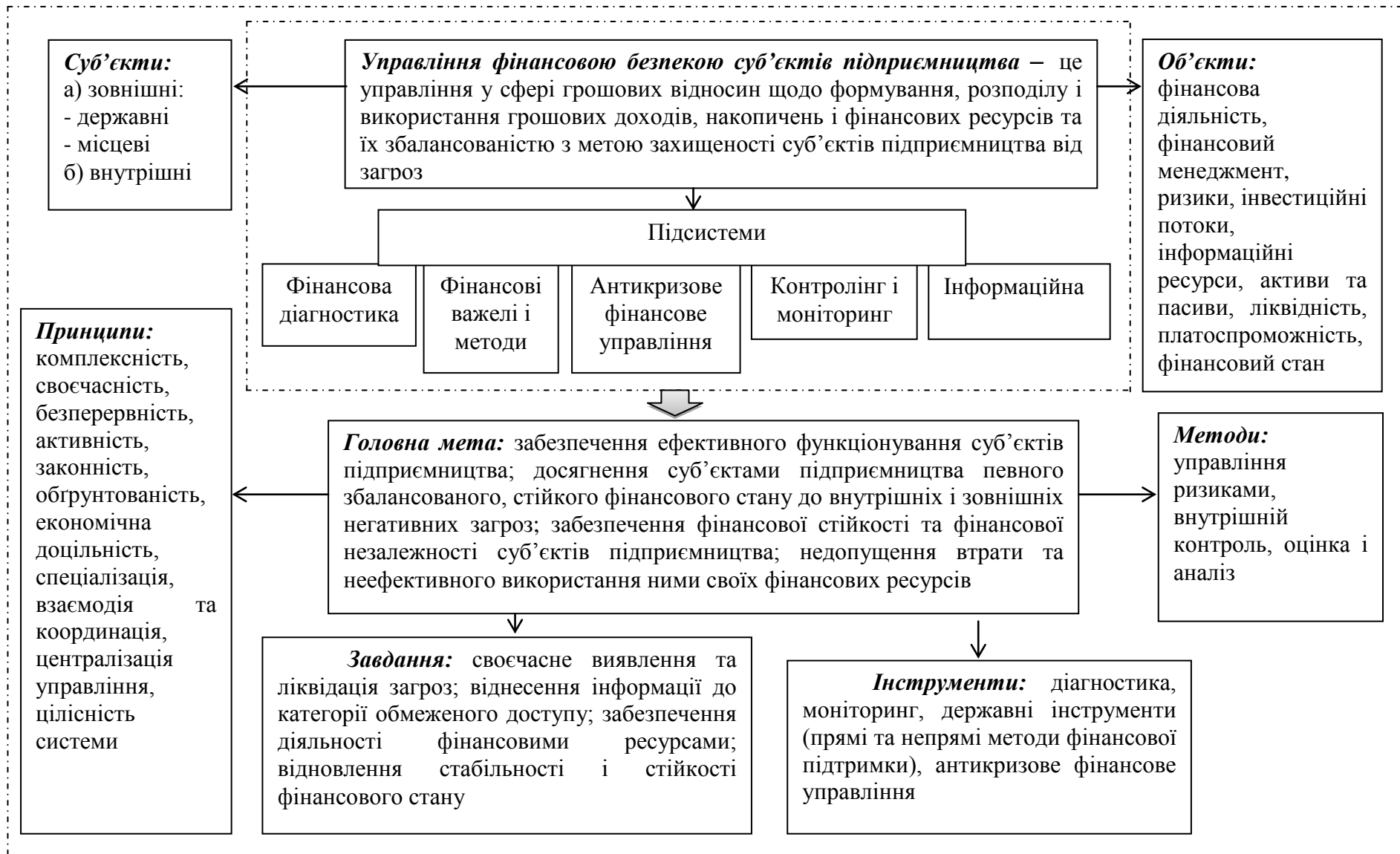
Рис. 1 Поелементна структура системи управління фінансовою безпекою суб'єктів підприємництва