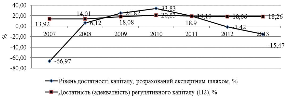
Рис. 2 Динаміка рівня достатності капіталу банків, розрахованого нормативним та експертним шляхом за період 2007-2013 рр.,%

Використання експертної оцінки рівня достатності капіталу банків у роботі було проведено на основі методу ієрархій. Отримані результати (рис. 2) засвідчили, що використання нормативного методу необхідне для підтримки регуляторних функцій НБУ щодо вимог до капіталу.