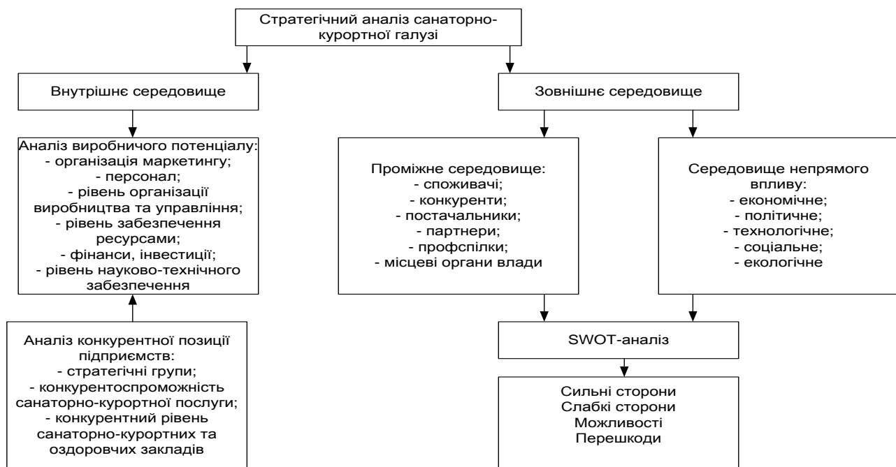
Рис. 2. Складові середовища функціонування санаторно-курортних та оздоровчих закладів (на основі [1])

У структурі діяльності галузі можна виділити три рівні середовища: внутрішнє, середовище завдань (проміжне) та зовнішнє (рис. 2). Внутрішнє середовище є сукупністю факторів, що формують довгостроковий прибуток і знаходяться під безпосереднім контролем власників, керівників, персоналу. Зовнішнє середовище включає в себе фактори, на які підприємства даної галузі не можуть впливати або їх вплив є незначним. Поміжне середовище включає фактори, на які санаторно-курортні заклади можуть впливати шляхом комунікацій.