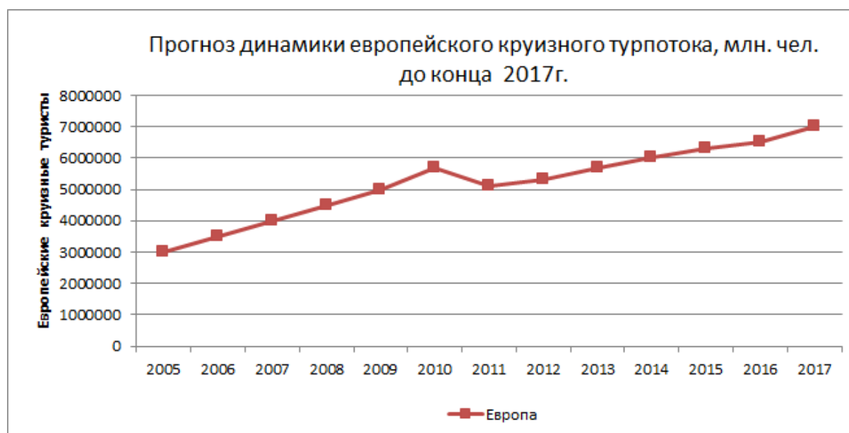
Рис. 2. Прогноз динамики европейского круизного турпотока до 2017 года, млн. чел [6]

По прогнозам специалистов, в 2017 г. морские круизы привлекут внимание 7,0 млн. европейских туристов (рисунок 2).