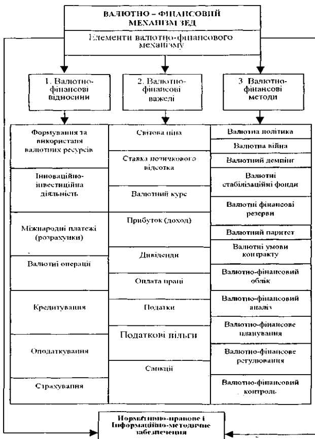
Рис.1. Валютно-фінансовий механізм ЗЕД [3, с. 37]

аспекту не підпадає під сумніви. Банківська система є провідним сектором вітчизняної фінансової системи.