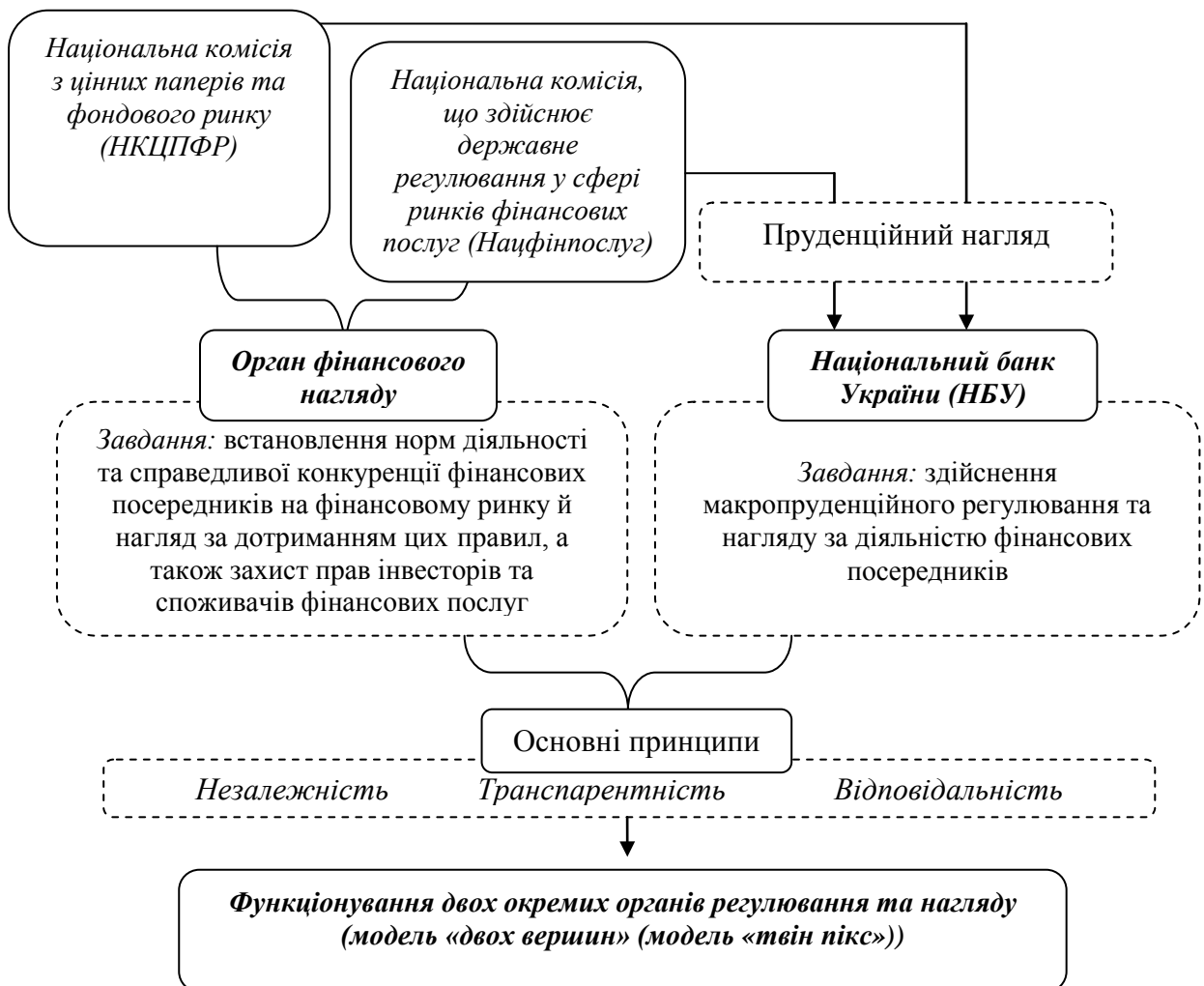
Рис. 4. Реорганізація державних органів регулювання та нагляду на фінансовому ринку України

У дослідженні запропоновано напрями реорганізації системи органів регулювання та нагляду за діяльністю фінансових посередників за допомогою функціонування двох незалежних регуляторних органів, один із яких – Національний банк України, який здійснюватиме макропруденційне регулювання та нагляд за діяльністю фінансових посередників, інший – орган фінансового нагляду – відповідатиме за встановлення норм діяльності й конкурентної боротьби фінансових посередників на фінансовому ринку, а також здійснюватиме нагляд за дотриманням цих правил, захищатиме права інвесторів та споживачів фінансових послуг. Реорганізацію державних органів регулювання та нагляду на фінансовому ринку України схематично подано на рис. 4.