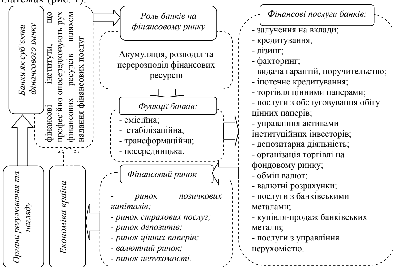
Рис. 1. Основні функціональні ознаки банківської діяльності на фінансовому ринку

У першому розділі « Теоретико-методичні основи діяльності банків як фінансових посередників » виділено функціональні ознаки банківської діяльності на фінансовому ринку, обґрунтовано економічну сутність, функції, принципи фінансового посередництва та його вплив на розвиток фінансового ринку, досліджено вплив глобалізаційних процесів на розвиток фінансового посередництва. На основі одержаних у дослідженні результатів визначено ключову роль банків на фінансовому ринку, що реалізується шляхом здійснення ними функцій і полягає у опосередкуванні, акумуляції, розподілі та перерозподілі фінансових ресурсів. Аналіз існуючих підходів до функцій банків дав змогу дисертанту доповнити їх посередницькою функцією, що проявляється через посередництво на ринку цінних паперів та посередництво у платежах (рис. 1).