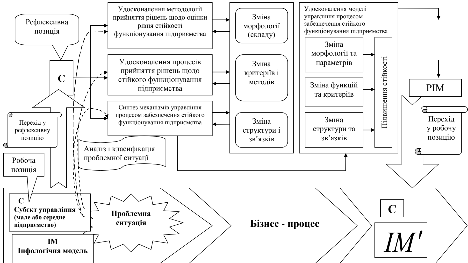
Рис. 1. Схема механізму управління процесом забезпечення стійкості функціонування підприємств малого бізнесу на базі системно-праксеологічного підходу