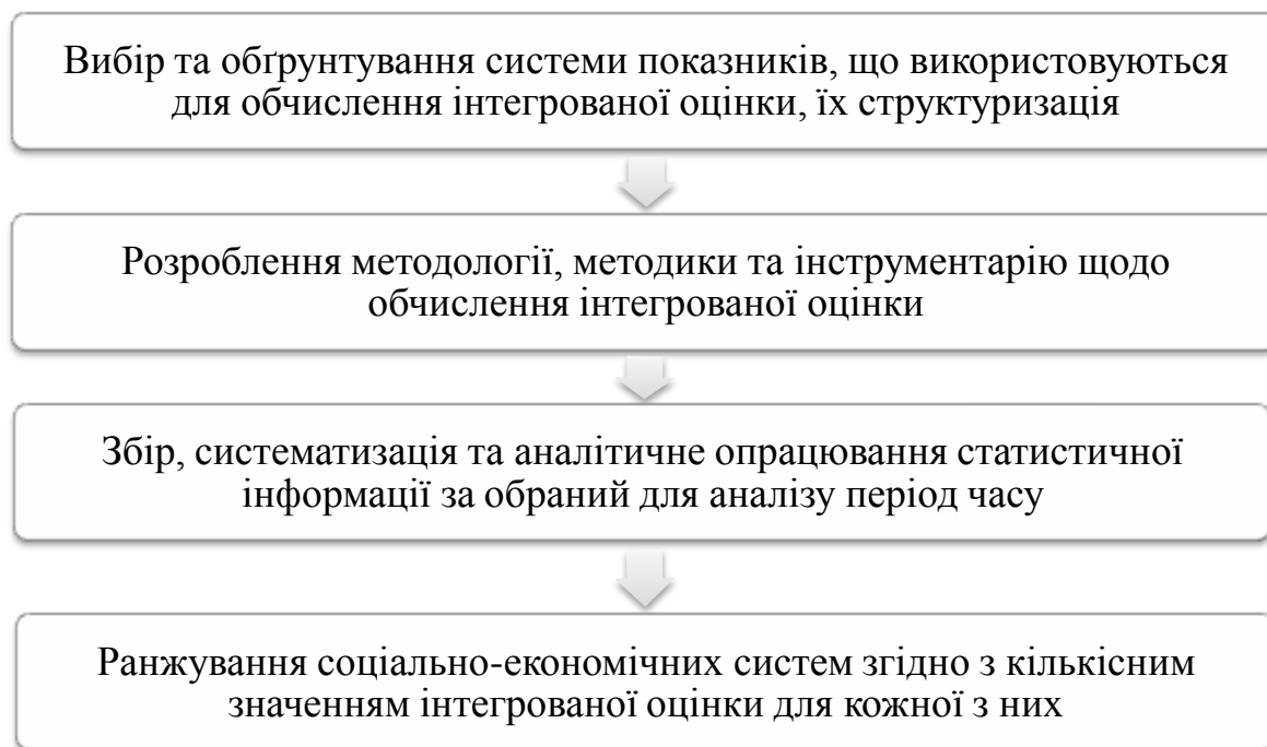
Рис. 1. Основні етапи інтегральної комплексної оцінки рівня розвитку соціально-економічних систем мезорівня

Основні етапи інтегральної комплексної оцінки соціально-економічного розвитку територій мезорівня представлені на рис. 1.