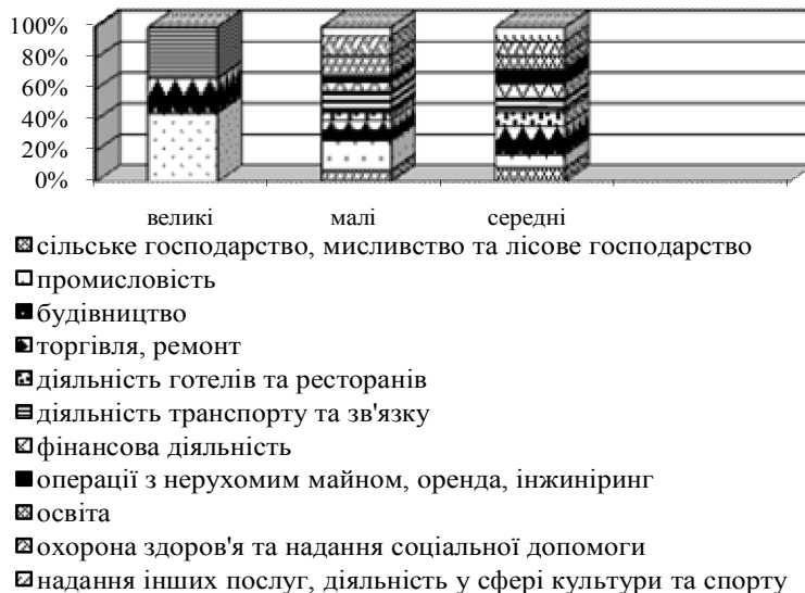
Рис. 3. Кількість підприємств за розмірами та видами економічної діяльності у 2012 р., %

Середньомісячна заробітна плата найманих працівників та фонд оплати праці на малих підприємствах за регіонами у 2011 р. подана на рисунку 4.