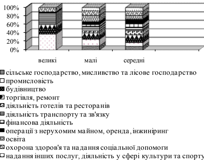
Рис. 2. Кількість підприємств за розмірами та видами економічної діяльності у 2011 р., %