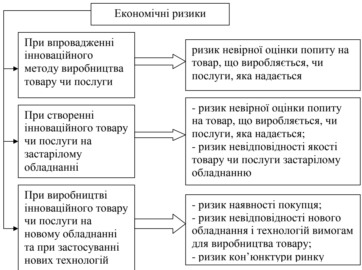
Рис. 1. Структуризація виникнення економічних ризиків при впровадженні інновацій на підприємстві

Для структуризації підходів при управлінні економічними ризиками в умовах запровадження інновацій на підприємствах виділені варіанти їх виникнення, що подані на рисунку 1. Вони характеризуються виробничий процес та виявляють закономірності, пов'язані з просуванням інноваційного товару чи послуги на відповідний ринок.