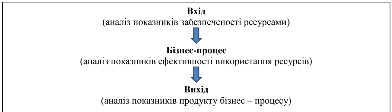
Рис.2.Етапи аналізу показників окремого бізнес-процесу

та методів організації тощо. Початок окремо взятого процесу (потоків роботи) – це початковий вхід або ресурси процесу, до яких можна віднести матеріально-технічні, енергетичні, людські, інформаційні ресурси. Кінець процесу – це результат-продукт, з якого починається наступний процес (рис.2).