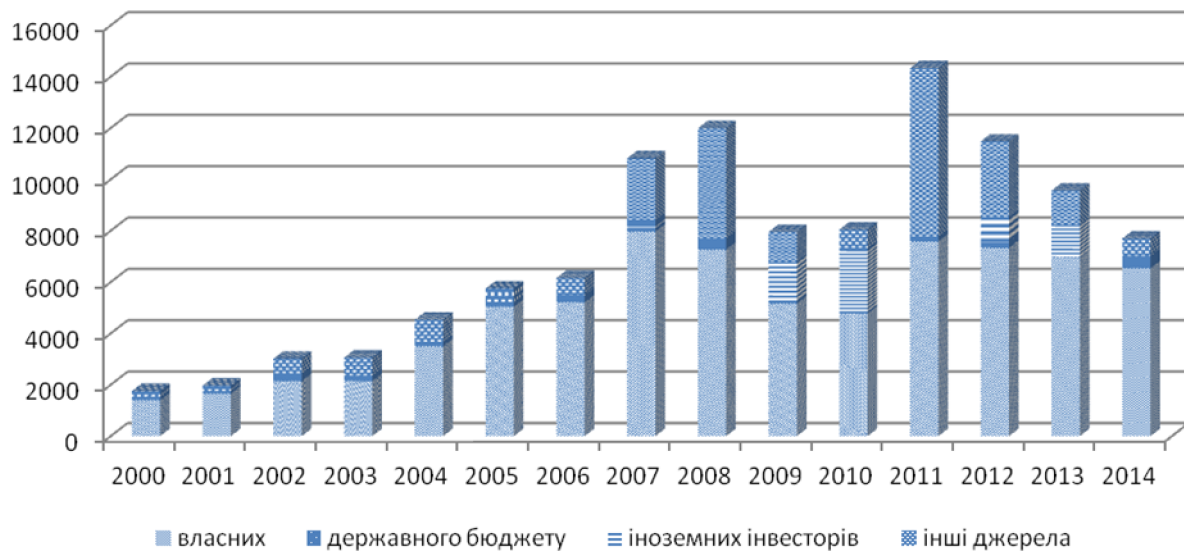
Рис. 2. Джерела фінансування інноваційної діяльності вітчизняних підприємств, 2000–2014 рр. (розроблено автором за даними [2])

Основним показником ефективності нововведень виступає економічний ефект, який включає суму всіх кількісно та якісно виразних результатів впровадження інновації. Залежно від поставленої мети та кола вирішуваних завдань величину ефекту обчислюють на народногосподарському (загальний ефект за умов використання нововведень) та внутрішньогосподарському рівні (ефект, одержуваний окремо розробником, виробником і споживачем технічних новин або нововведень) [3, с.220]. Як показав аналіз статистичних даних аналізованих наукоємних підприємств України, які здійснюють діяльність в межах тієї ж самої галузі, найбільш високі показники мають ті з них, які своєчасно здійснили інвестиції у розробку з подальшим впровадженням нової технології (рис. 3).