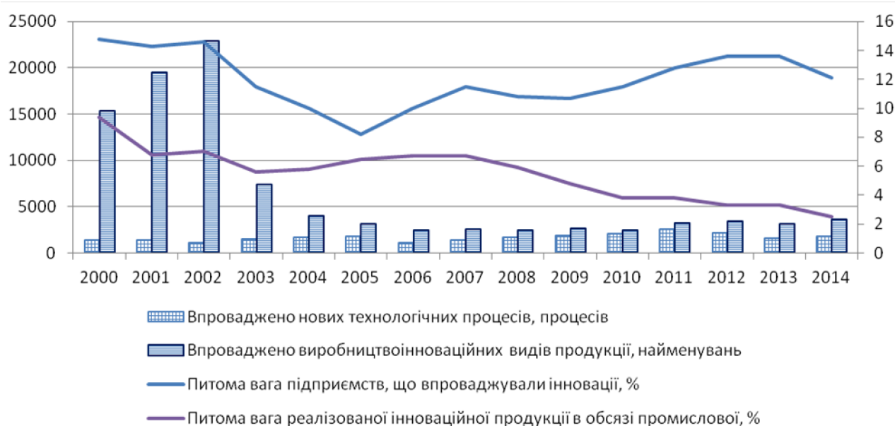
Рис. 1. Динаміка інноваційної активності підприємств України, 2000–2014 рр. (розроблено автором за даними [2])

Виклад основного матеріалу дослідження. Проведений аналіз статистичних даних виробничих підприємств України свідчить про стрімке скорочення інноваційної активності, починаючи з 2003–2004 років (рис. 1), незважаючи на економічне зростання в країні. Збільшення питомої ваги підприємств, що впроваджували інновації, у загальній кількості вітчизняних підприємств має стрибкоподібний характер, проте обсяг впровадження інноваційних технологій та продукції скорочується. Зазначена тенденція дозволяє дійти висновку, що новостворені господарюючі суб'єкти не приділяють достатньої уваги інноваційному розвитку, формуванню інноваційного потенціалу задля довготривалого існування на ринку.