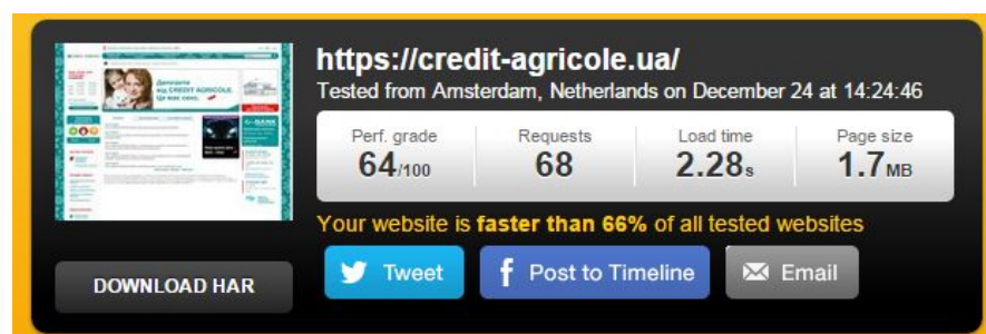
Рисунок 1. – Время полной загрузки корпоративного ресурса

1. Скорость загрузки. Для определения скорости загрузки использовано услугу сайта http://tools.pingdom.com . Время полной загрузки корпоративного ресурса ПАО «Креди Агриколь» составляет 2,28 секунды, что представлено на рис.1.