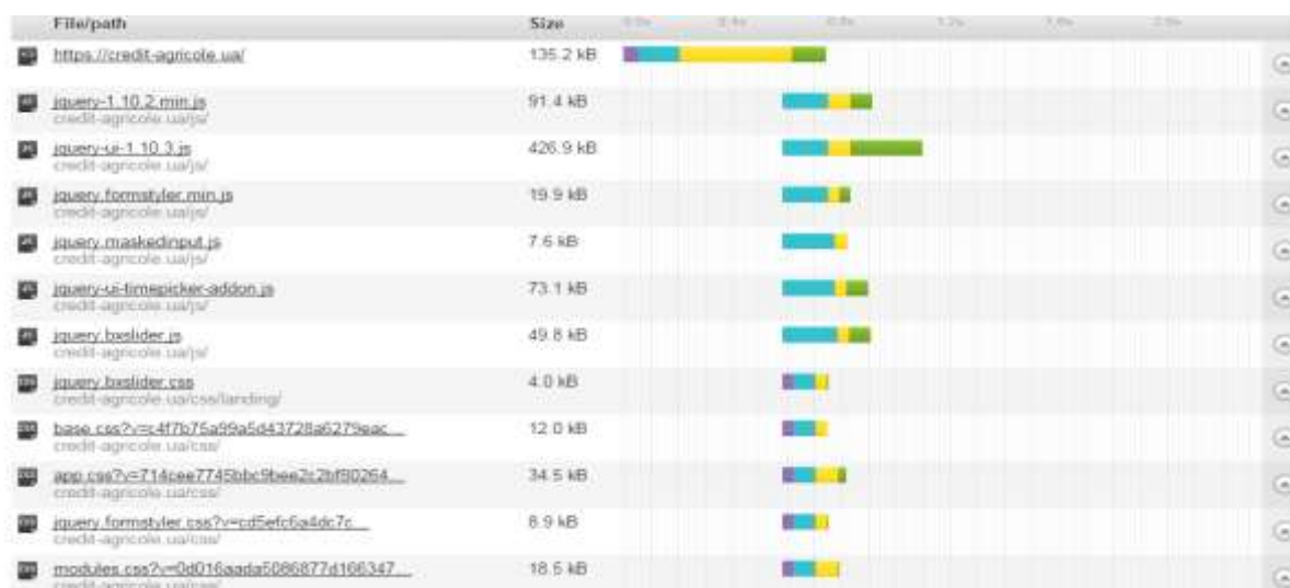
Рисунок 2. – Размеры и объем загрузки компонентов корпоративного сайта ПАО «Креди Агриколь»

Скорость загрузки корпоративного сайта обусловлена следующими факторами: размещение на украинском хостинге; яркое оформление сайта; наличие flash-анимации и других дополнений. 2,28 секунды является хорошим показателем наряду с уровнем анимации, которая предоставлена на сайте. Анализ распределения времени на загрузку компонентов сайта показан на рис.2.