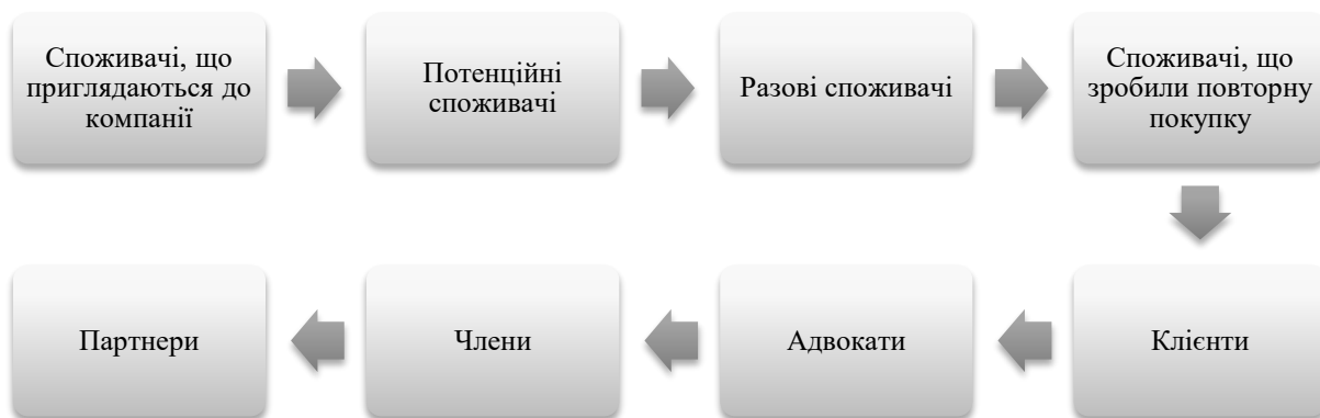
Рис. 3. Класифікація взаємовідносин з клієнтами за Ф.Котлером [1, с. 509-511]

А.Пейн запропонував шестирівневу класифікацію клієнтів: перспективний клієнт, споживач, постійний клієнт, адвокат, член, партнер []. Перехід з одного етапу до іншого відбувається внаслідок зростання рівня взаємовідносин та довіри між компанією та клієнтом. Ф.Котлер розширив дану класифікацію та виділив 8 видів клієнтів [1, ] (рис. 3).