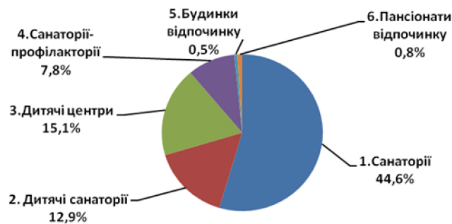
Рис. 3. Структура доходів спеціалізованих засобів розміщування Одеської області у 2014 році, % (розроблено на підставі [2, с.8])

Найбільша питома вага доходів у 2012–2014 роках припадала на санаторії (42,9–44,6%), бази та інші заклади відпочинку (27,8–18,3%). Значно збільшилася протягом 2012–2014 років питома вага доходів дитячих санаторіїв та дитячих центрів. У структурі доходів в 2014 році превалюють доходи санаторіїв – 44,6%, баз та інших закладів відпочинку – 18,3%, дитячих центрів – 15,1%, дитячих санаторіїв – 12,9% (рис. 3).