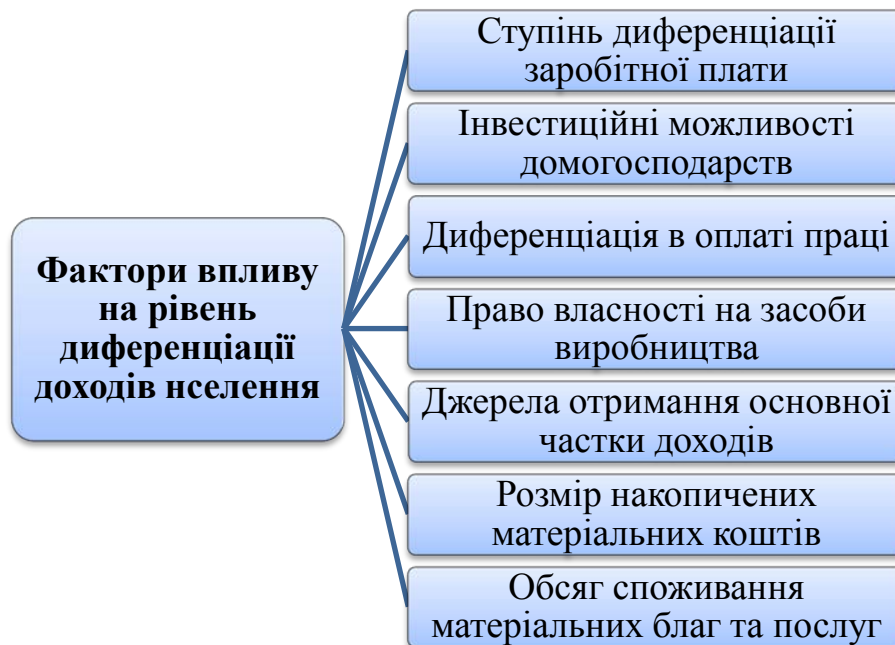
Рис. 2. Фактори впливу на рівень диференціації доходів населення

Диференціація оцінюється не тільки за рівнем доходів в цілому, але і за розміром домогосподарств та соціально-демографічними типами, зайнятістю, співвідношенням числа зайнятих та утриманців. Але, головними ознаками диференціації залишаються рівень оплати праці та інших первинних доходів (Рис. 2.).