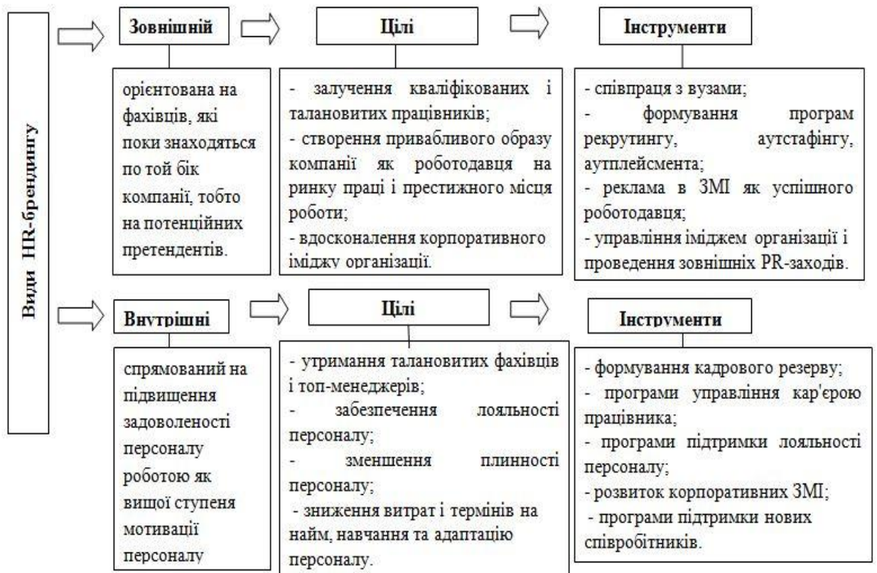
Рис. 1. Цілі та інструменти HR-брендингу [3, с.182]