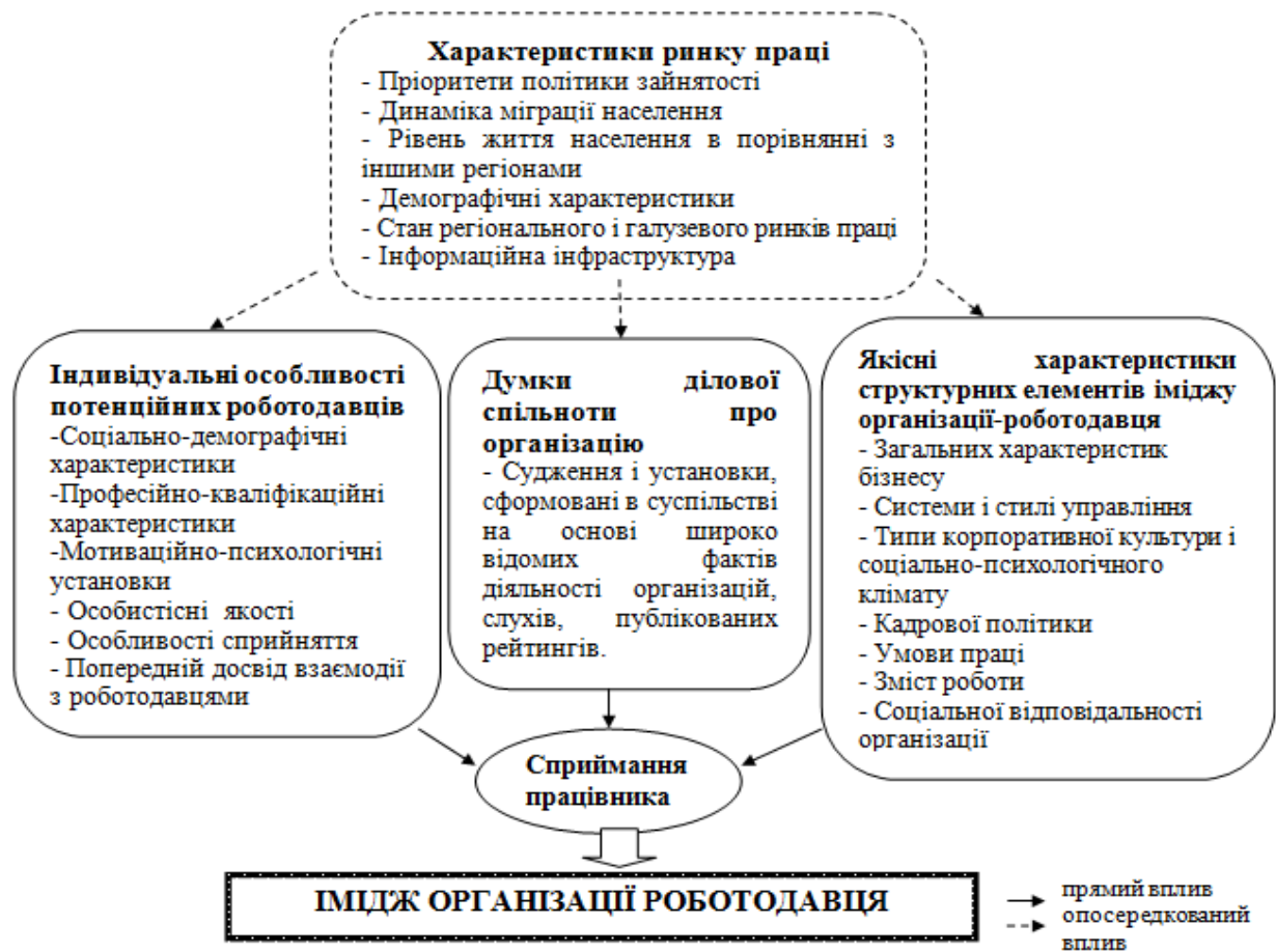
Рис 3. Фактори, що впливають на формування іміджу організації-роботодавця [4, с.12]

Задачі щодо підвищення привабливості компанії як роботодавця ставить перед своїми HR-департаментами керівництво більшості українських компаній.