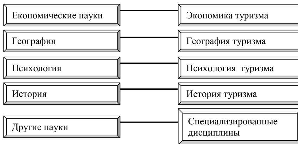
Рис. 1. Туризм как составляющая других наук

Наглядно этот тезис продемонстрирован на рис. 1.