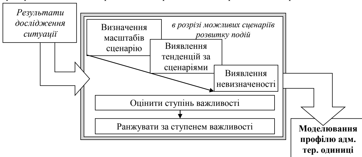
Рис. 1. Процес розробки сценарію соціально-економічного розвитку адміністративно-територіальних одиниць

Загальна схема моделювання соціально-економічного розвитку адміністративно-територіальних одиниць держави за сценарним підходом представлена на рис. 1.