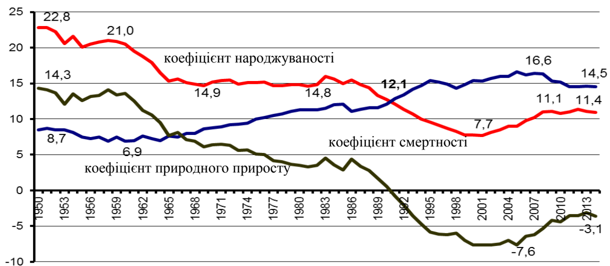
Рис. 1. Динаміка коефіцієнтів природного руху населення України за 1950-2014 рр.

З 1992 року Україна вступила в період депопуляції, тобто скорочення чисельності населення в результаті перевищення рівня смертності над рівнем народжуваності, що наочно видно на рисунку 1.