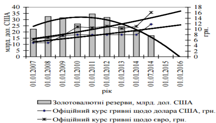
Рис.1. Динаміка обсягів золотовалютних резервів та курсу гривні щодо іноземних валют упродовж 01.01.2007-01.01.2016 рр.

Висока залежність вітчизняної фінансової системи від світового банківського сектора робить країну чутливою до коливань валютних курсів і викликає додаткові ризики в разі швидкого відтоку іноземного капіталу. Таким чином, в період 01.01.2007-01.01.2016. офіційний курс гривні по відношенню до долара США і євро впали майже в 3 рази. Політична та економічна нестабільність в країні, тиск зовнішньої заборгованості, скорочення валютних резервів призвело до найбільшої в останні роки, девальвації валюти на 97% по відношенню до долара США на 74,18% - по відношенню до євро. ( рис. 1).