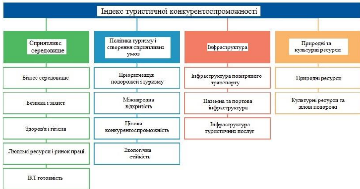
Рис. 1. Складові індексу туристичної конкурентоспроможності

На Рис. 1 наведені складові індексу згідно до їх підпорядкованості [13].