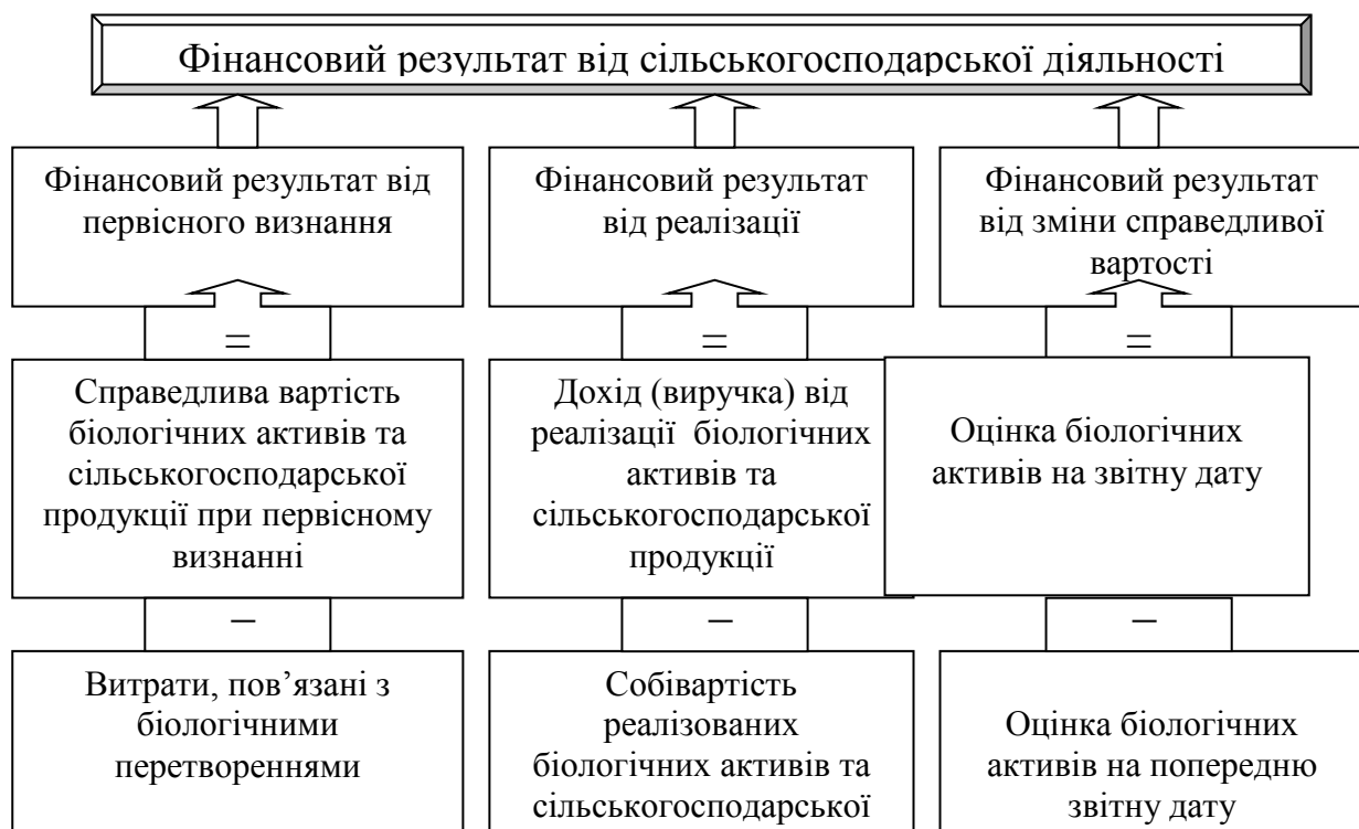
Рис. 2. Формування фінансового результату від основної діяльності сільськогосподарських підприємств

Відповідно до вимог цього стандарту фінансовий результат від основної діяльності формується з трьох складових (рис. 2).