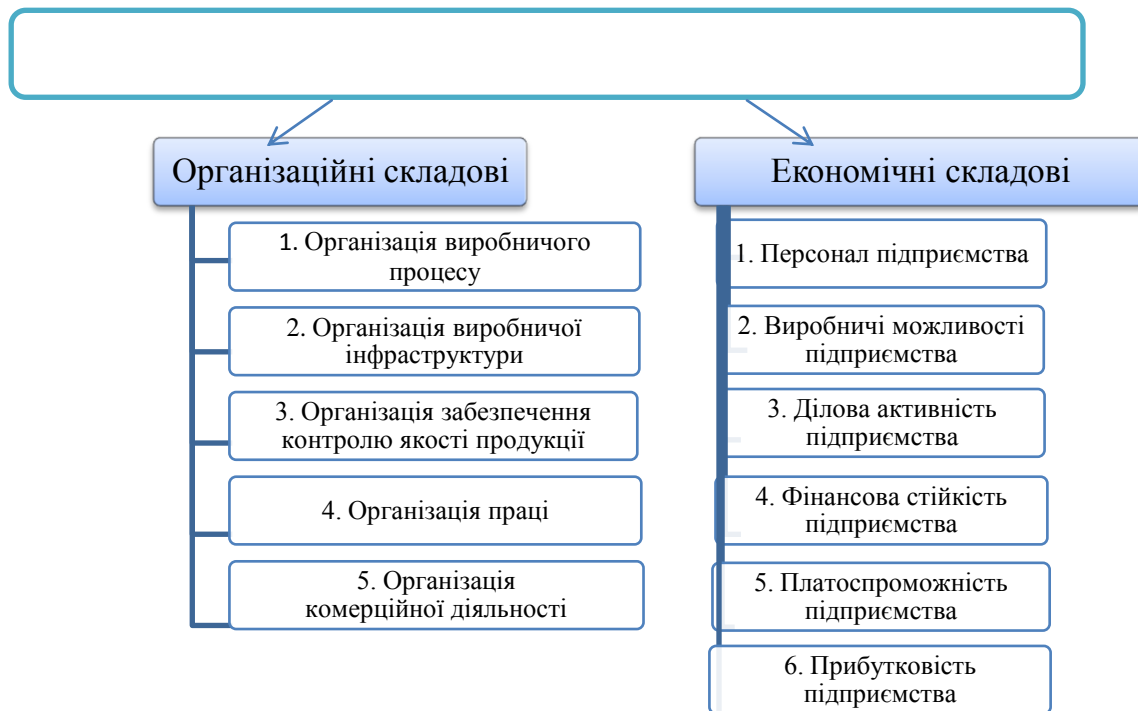
Рис.2. Організаційно-економічні складові конкурентоспроможності підприємств

(узагальнюючими). Фактично кожна складова має бути оцінена за допомогою ряду аналітичних показників.