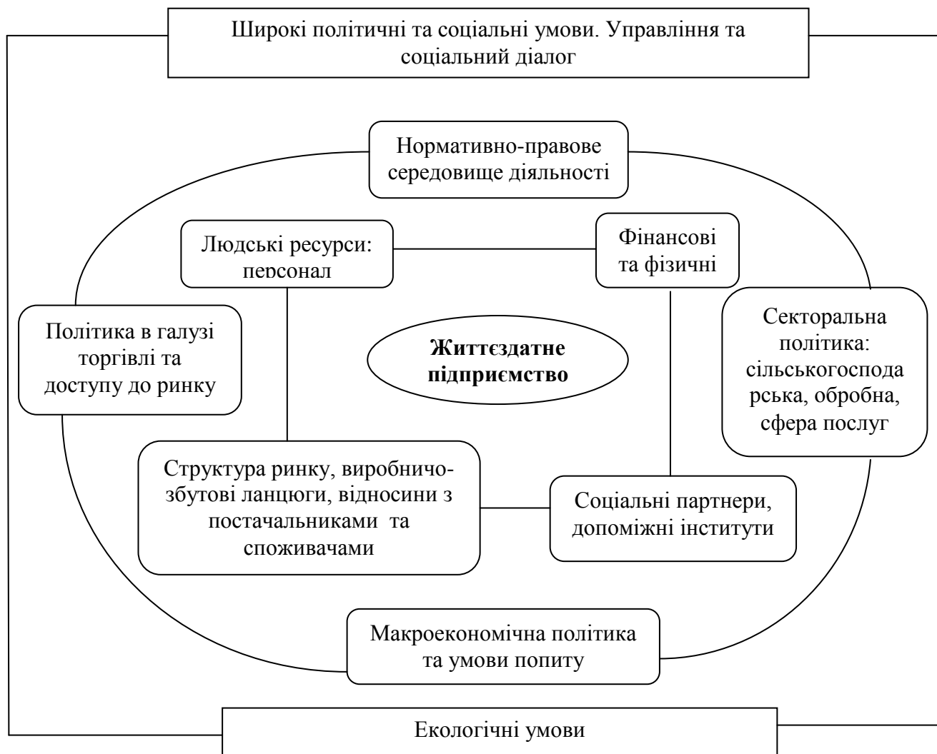
Рис.2 – Рівні факторів життєздатного підприємства

До факторів мікрорівня, по суті відносяться ті фактори, які показують, що відбувається усередині підприємства або в його безпосередньому оточенні (управління людськими і фінансовими ресурсами і використання таких фізичних ресурсів, як енергія, транспорт і комунікаційні системи), а також такий чинник, як безпосередні взаємозв'язки між підприємствами і їх замовниками/споживачами і постачальниками.