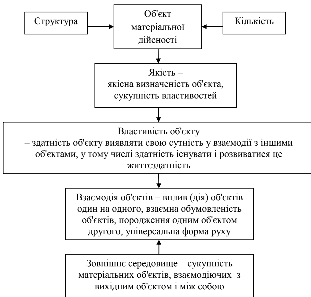
Рис. 1 – Схема формування і прояву життєздатності матеріального об'єкту

Як видно, вищенаведена характеристика категорії "життєздатність" побудована на основі загальних понять і в загальному вигляді може бути застосовна до будь-якого виду матеріальних об'єктів, у тому числі і підприємства, а її положення можуть використовуватися як перевіірочні критерії достовірності результатів досліджень конкретних об'єктів. Істотні зв'язки використаних в характеристиці категорій і їх понять узагальнені в схемі, яку наведено на рис. 1.