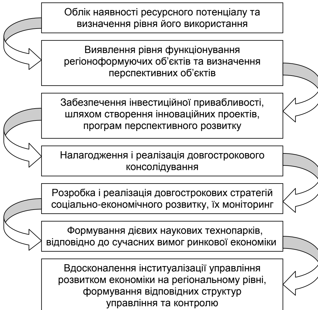
Рис. 1. Механізми модернізації розвитку ринкової економіки

Державне управління в повній мірі спроможне прискорити економічний розвиток країни та її регіонів, що визначається ефективністю функціонування певних сфер діяльності. Це, в свою чергу, дозволяє визначити пріоритетні напрямки модернізації управління цим розвитком через удосконалення чи впровадження конкретних механізмів (рис. 1).