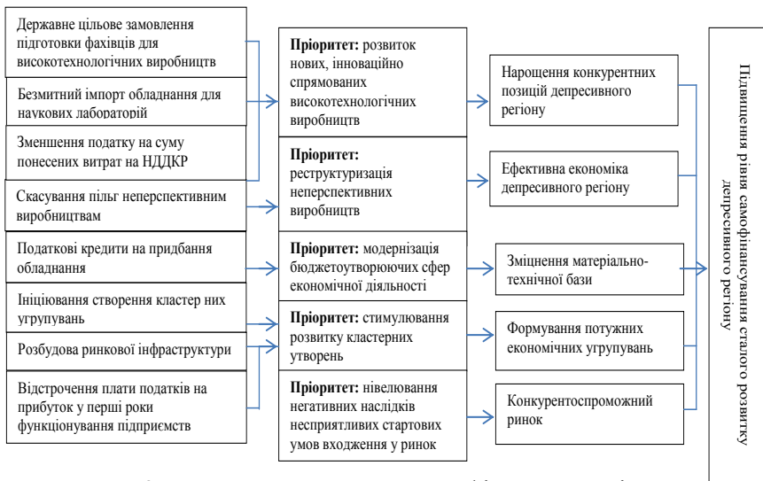
Рис. 2. Узагальнена система фінансових інструментів стимулювання розвитку пріоритетних сфер депресивного регіону

На рис. 2 подано узагальнену систему фінансових інструментів стимулювання розвитку пріоритетів сталого розвитку депресивного регіону та наслідки їх застосування для регіону.