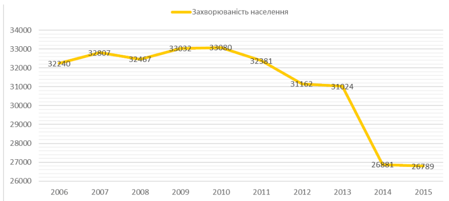
Рис. 1. Динаміка рівня захворюваності населення України

До 2010 року в країні був досить стабільний рівень захворюваності населення. Починаючи з 2010 року почалась позитивна динаміка до зменшення кількості захворювань. В 2014 році, ми бачимо, різкий скачок вниз, що обумовлено політичними подіями, які відбувалися у той момент в країні. У 2015 році порівняно з 2006 роком кількість захворювань зменшилась майже на 17 %. (рис. 1). В першу чергу це обумовлене зменшенням кількості населення України.