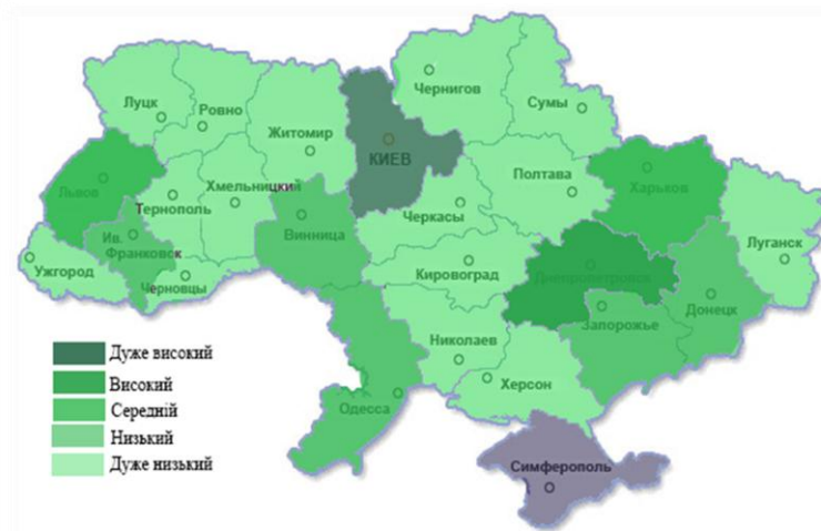
У групу областей з низьким рівнем захворюваності потрапили Рівненська, Хмельницька, Черкаська, Житомирська, Полтавська, Закарпатська, Миколаївська, Чернігівська, Волинська, Тернопільська, Кіровоградська, Херсонська, Сумська, Чернівецька Луганська область. Рівень захворюваності населення залежить від якості медичного обслуговування населення та витрат на охорону здоров'я в країні.

При регіональному аналізі захворюваності населення було виявлено, що у 2015 році в Україні більша частка регіонів має дуже низький рівень захворюваності (рис. 3), ця група займає 62,2% загальної кількості регіонів, однак серед регіонів України виділяються 1 регіони з дуже високим рівнем захворюваності населення, це Київська область і також 1 регіон з високим рівнем захворюваності населення це Дніпропетровська область.