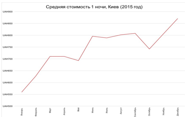
Рис.4 Средняя стоимость 1 ночи в Киеве в 2015 г.

Стоимость аренды зависит от месяца и от спроса (рис. 3 и 4). Для Одессы самое горячее время – лето. Средние цены в летние месяцы – около 1000 грн. В декабре (и даже на Новый Год) – около 850 грн. В Киеве самые дорогие месяцы – август и декабрь. Средние цены стартуют от 569 грн/ночь, начинают расти в марте, к декабрю средняя цена за ночь достигает 800 грн.