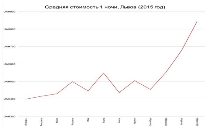
Рис. 5 Средняя стоимость 1 ночи во Львове , 2015 г.

Львов оказался самым недорогим городом: минимальная средняя цена за ночь – 399 грн (в январе), максимальная – 843 грн в декабре (рис. 5).