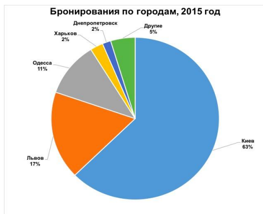
Рис.2 Бронирование турпоездок по городам Украины в 2015 году

В 2015 году на Киев приходится больше половины всех онлайн-бронирований – 63%, далее идет Львов – 17%, Одесса – 11%, в остальные 9% вошли такие города, как Николаев, Ровно, Сумы, Полтава (рис. 2).