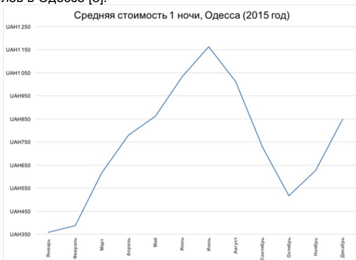
Рис.3 Средняя стоимость 1 ночи в Одессе в 2015 г.

По уровню цен на отели Украина находится на 110 месте рейтинга туристической конкурентоспособности. Швейцария занимает 114 место. Несмотря на такой дисбаланс между ценами на отели и покупательной способностью украинцев, базы отдыха и гостиницы эконом-класса в 2014 году подняли цены в среднем на 20-30%. Это связано в первую очередь с увеличением расходов, так коммунальные платежи подорожали почти 30%. Так шесть ночей в Одесской области на семью из трех человек обойдутся в среднем в 4000 гривен. На курорте Стрелковое (Арабатская стрелка, Херсонская область) проживание с трехразовым питанием обойдется в 200-400 гривен в сутки. В Скадовске (Херсонская область) можно найти номера в мини-отелях по цене 40-50 гривен с человека без питания. Сегмент нижнего ценового диапазона начал развиваться только в последние пару лет, как следствие появилось большее количество мини-отелей, хостелов. В настоящий момент уже зарегистрировано около 30 хостелов в Одессе [3].