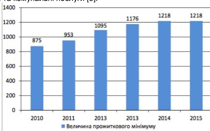
Рис.1 Прожитковий мінімум в Україні

бідність. За результатами останніх соціологічних опитувань тільки 2% дорослого населення України вважають себе багатими, майже 8% зараховують себе до середнього класу, а решта самоідентифікуються як бідні. Такі показники не є дивиною, якщо подивитись на рівні прожиткового мінімуму та мінімальної заробітної плати в Україні. Прожитковий мінімум на працездатну особу на даний час в Україні становить, як і в 2014 р., 1218грн. Лише з 1 грудня він збільшиться на 13% – до 1330 грн. (для порівняння: прожитковий мінімум у 2011 р. – 953 грн., у 2012 р. – 1095, у 2013 р. – 1176, у 2014 р. – 1218, у 2015 р. – 2018 грн.). Але, як бачимо, цифри свідчать, що такий прожитковий мінімум не забезпечить людям нормальний рівень життя при сьгоднішніх ринкових цінах на товари споживання та комунальні послуги [5].