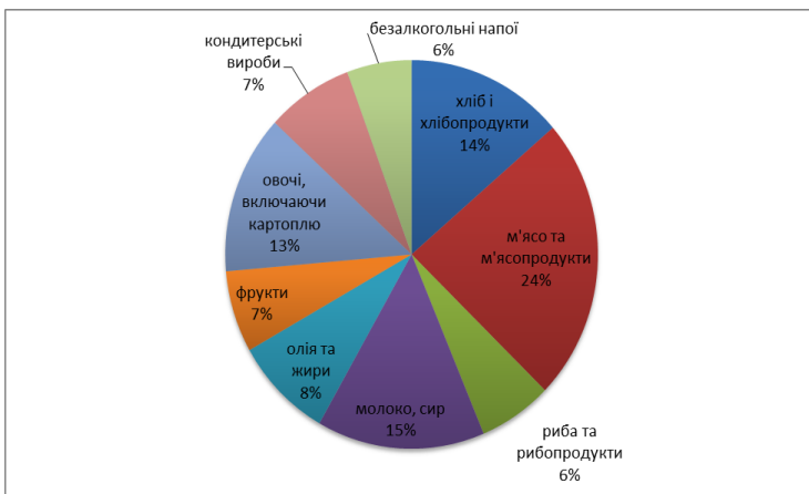
Рис. 2. Структура споживчих витрат населення України на продукти харчування у 2013 році

Аналіз рівня витрат на продукти харчування серед споживчих витрат населення європейських країн, відображає високі частки в країнах, що розвиваються – 30-50%, та низькі на культуру – 1-5%. Рівень витрат на культуру і відпочинок та продукти харчування виражає обернено пропорційну закономірність, чим більше витрачає населення на товари першої необхідності, тим менше собі може дозволити відпочивати [3].