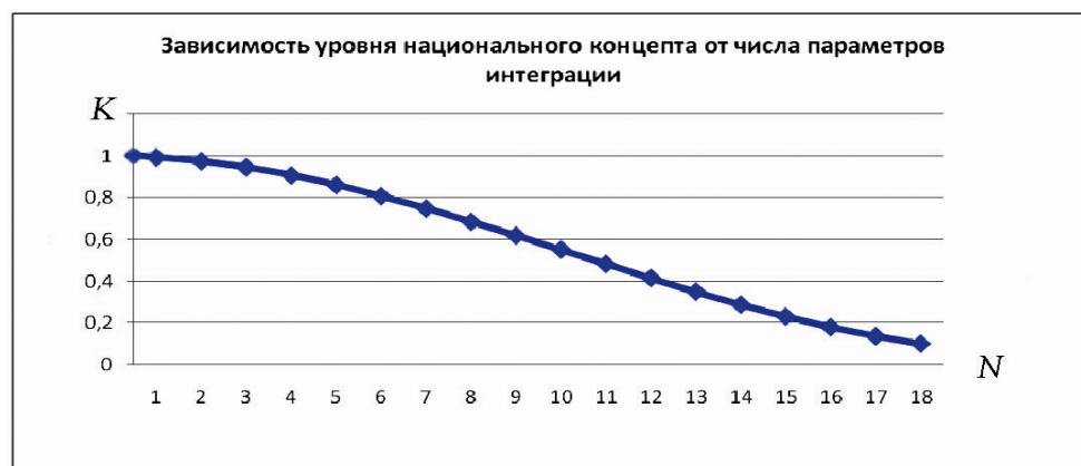
Рис. 2. Залежність рівня національного концепту від числа параметрів інтеграції

Графік функції K(N) представлений на рис. 2.