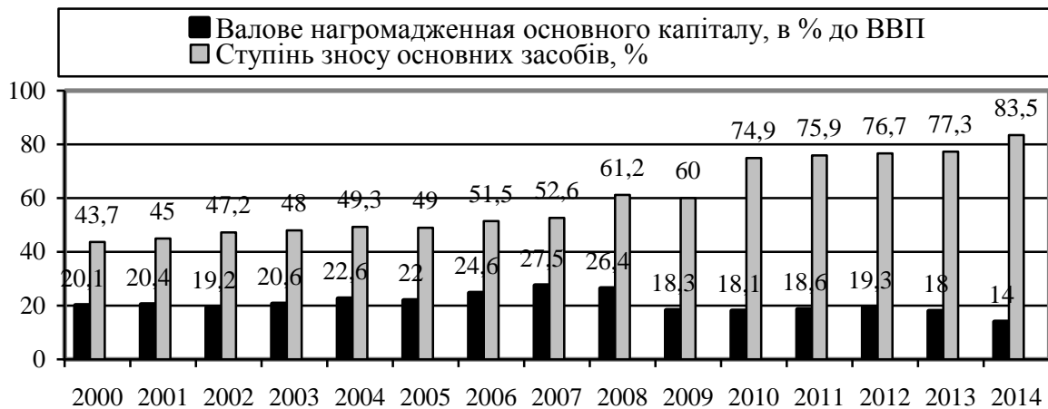
Рис. 1. Валове нагромадження основного капіталу в % до ВВП та ступінь зносу основних засобів в 2000–2014 рр.

Рисунок 1 є доказом того, що капіталоозброєність може зростати і в умовах науково-технічної інволюції (скорочення норми нагромадження, деградації основного капіталу).