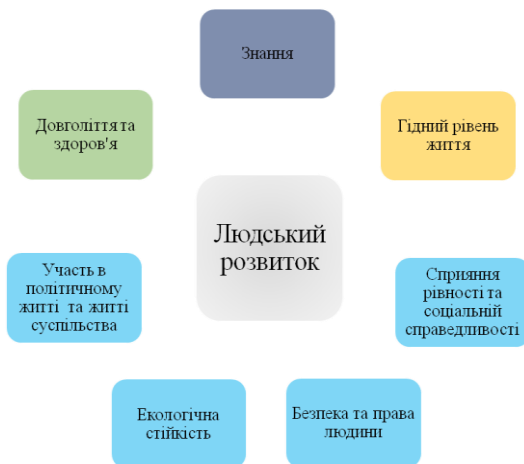
Рис. 1. Фактори впливу на людський розвиток

Значення Індексу людського розвитку залежить від багатьох факторів, які прямо та опосередковано впливають на нього. Зокрема, довголіття, знання та достойний рівень життя напряму сприяють підвищенню людського потенціалу, а створюють умови для людського розвитку: участь в політичному житті та житті суспільства, екологічна стійкість, безпека та права людини, сприяння рівності та соціальній справедливості (рис. 1).