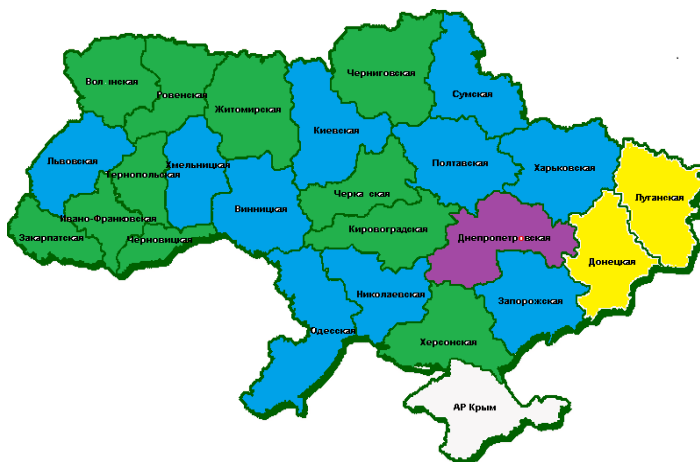
Рис. 2. Розподіл областей України за рівнем середньодушових сукупних доходів населення у 2016 р.

Наочно розподіл областей України за рівнем середньодушових сукупних доходів населення представлено на рис. 2.