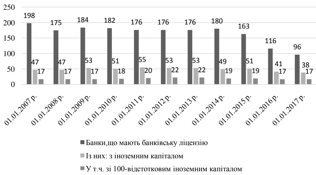
Рис.1 Кількість банків в Україні у період 2007-2016 рр. [3]

Як ми можемо спостерігати з рисунку, наведеного нижче, структура іноземного капіталу в банківській системі зазнала деяких змін: на 01.01.2017 року в Україні функціонувало 96 банків, з яких 38 з часткою іноземного капіталу, а 17 зі 100-% іноземним капіталом. Підставою для того, щоб признати банк неплатоспроможним, є існуючі проблеми банку з виконанням обов'язків, недовірою на ринку, від'ємним власним капіталом та переважною кількістю проблемних заборгованостей.