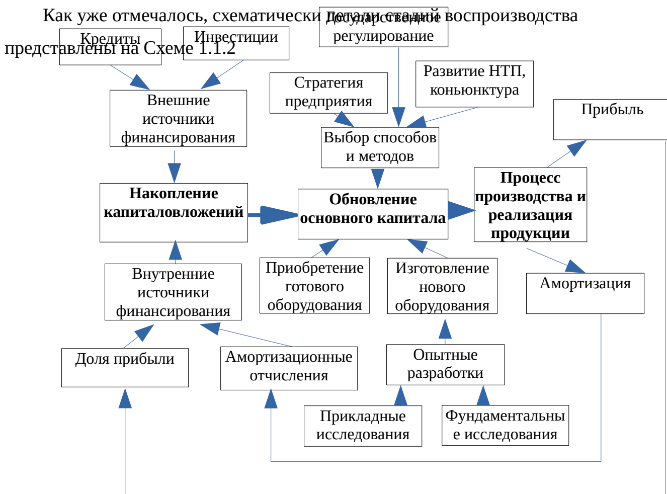
Схема 1.1.2 Воспроизводственный цикл основного капитала

На темпы и величину накопления капиталовложений оказывают непосредственное влияние источники финансирования, которые делятся по своему характеру на внешние и внутренние. К внутренним источникам накопления относятся прибыль и амортизация, ко внешним – кредиты, инвестиции и прочие заемные средства.