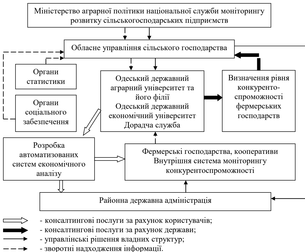
Рис. 2. Структура зовнішнього спостереження і визначення конкурентоспроможності фермерських господарств

На наш погляд, ця форма визначення конкурентоспроможності за змішаною моделлю врахування внутрішніх і зовнішніх факторів націлена на вертикальну інтеграцію функцій державних органів управління та дорадчих служб з метою формування регіональної структури спостережень і визначення конкурентоспроможності сільськогосподарських підприємств, в тому числі і фермерських господарств.