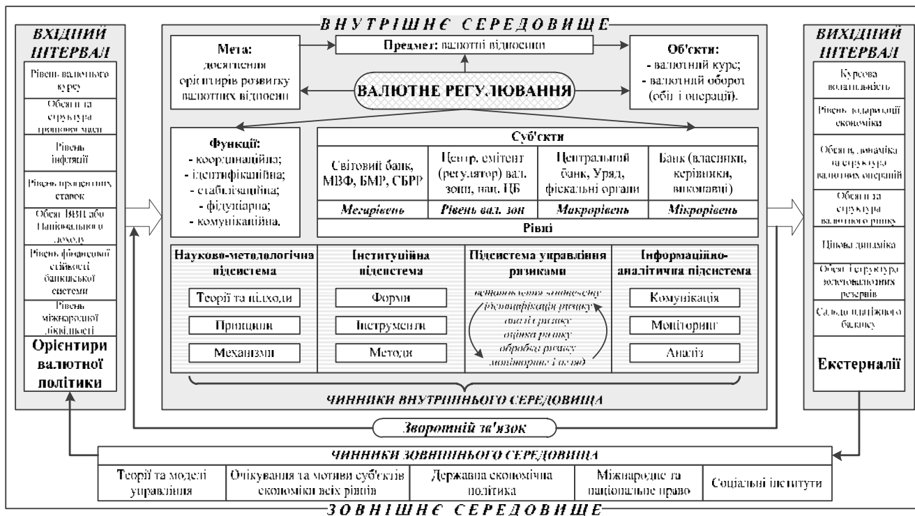
Рис. 2. Система валютного регулювання

Система валютного регулювання в загальному варіанті пояснює реалізацію орієнтирів валютної політики (які мають урахувувати чинники зовнішнього середовища) шляхом перетворення заданих вхідним інтервалом передумов у опосередковані вихідним інтервалом результати й екстерналії, що, завдяки зворотному зв'язку, впливають на коригування первісних орієнтирів у наступному регуляційному циклі (рис. 2).