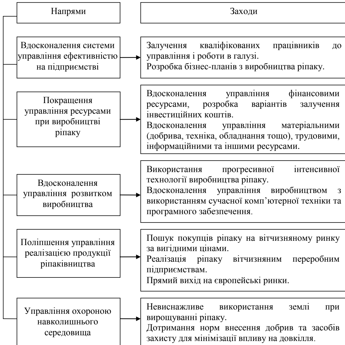
Рис. 3. Управлінські заходи підвищення ефективності виробництва ріпаку (розроблено автором)

необхідно підвищувати ефективність використання усіх ресурсів: матеріальних, трудових, фінансових тощо.