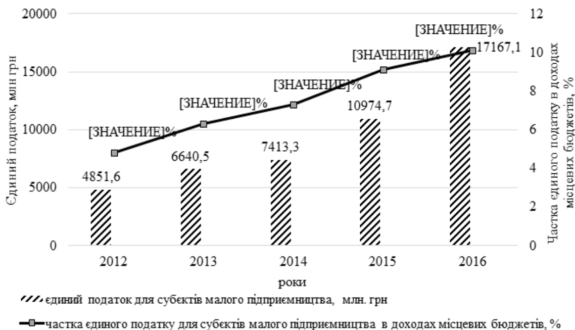
Рис. 2. Динаміка надходжень єдиного податку для суб'єктів малого підприємництва [узагальнено автором на основі [3, с. 69]]

Попри кризові явища в економіці, п'ятий рік поспіль продовжується зростання обсягів надходжень єдиного податку для суб'єктів малого підприємництва (рис. 2).