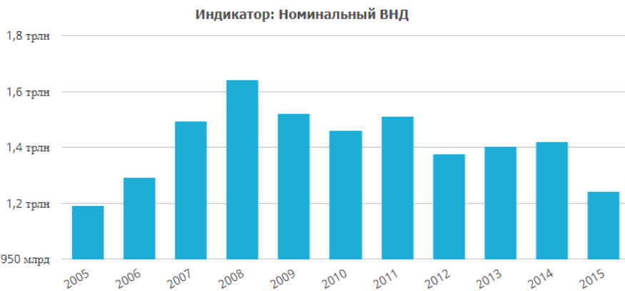
Рисунок 1. Динаміка ВНД Іспанії за 2005-2015 роки

Сальдо первинних доходів – це сума первинних доходів, отриманих резидентами даної країни за відповідний період, за вирахуванням доходів, переданих за кордон. \text{ВНД} = \text{ВВП} + \text{Сальдо первинних доходів} , отриманих з-за кордону або переданих за кордон (до таких першим доходах зазвичай відносять оплату праці, доходи від власності у вигляді дивідендів і т. п.) [4].