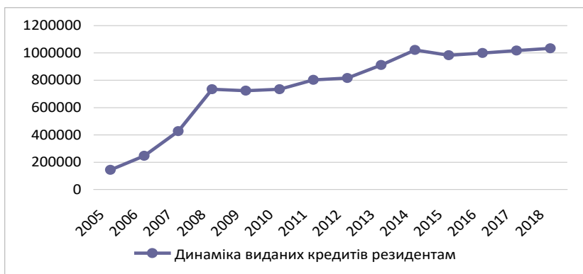
Рис. 1. Динаміки виданих кредитів резидентам банками України за період 31.12 2005 – 01.03.2018 рр., млн. грн.

Ми будемо досліджувати позики видані резидентам, так як вони складають основну частину кредитного портфелю.