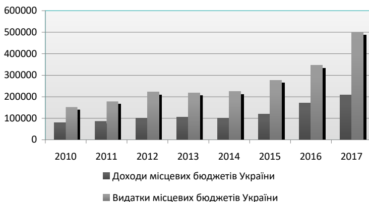
Рис.6. Динаміка доходів та видатків місцевих бюджетів України за 2010 – 2017 рр.

Місцеві бюджети – це фонди фінансових ресурсів, призначені для реалізації завдань і функцій, що покладаються на органи самоврядування [7]. Із коштів місцевих бюджетів фінансуються найзначніші заходи держави в галузі економіки та соціальної політики. За рахунок місцевих бюджетів утримуються заклади освіти, охорони здоров'я, проводяться виплати з соціального захисту та соціального забезпечення сім'ям з дітьми, ветеранам війни та праці, іншим незахищеним верствам населення, утримуються будинки-інтернати, притулки, фінансуються молодіжні програми.