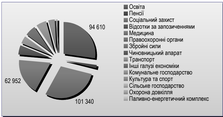
Рис.3. Розподіл видатків місцевого бюджету України за функціями у 2016 році, млн. грн.

Структура видатків місцевого бюджету України у 2016 р. представлена на рис.3.