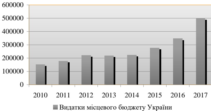
Рис. 2. Динаміка видатків місцевого бюджету України за 2010-2017 рр..

Структура видатків місцевого бюджету України у 2016 р. представлена на рис.3.