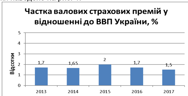
Рис.1. Частка валових страхових премій у відношенні до ВВП України Як бачимо на рис.1, за останні п'ять років частка валових страхових

Аналізуючи страховий ринок України як частину загального світового ринку, необхідно відмітити рівень його розвитку. Одним з таких показників є рівень проникнення страхування (обсяг страхових премій до ВВП). Частку валових страхових премій у відношенні до ВВП країни за 2013--2017 роки наведено на рис. 1.