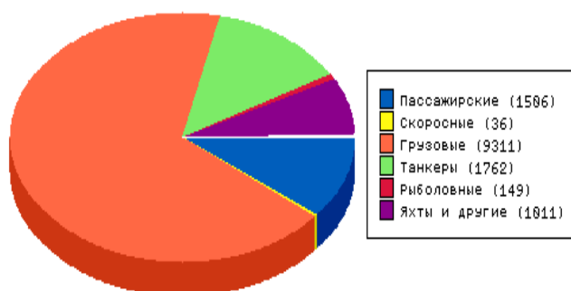
Рис. 3 – Загальна кількість судозаходів в Україну по типах судів [14].

Аналізуючи дану інформацію, слід зауважити, що у України як морської держави є декілька варіантів майбутнього розвитку морського круїзного туризму: