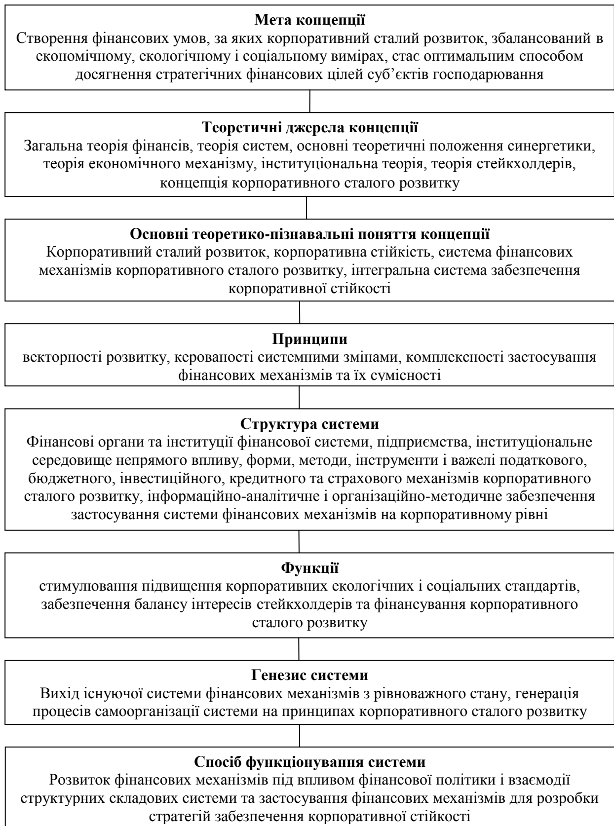
Рис. 1. Концепція формування і функціонування системи фінансових механізмів корпоративного сталого розвитку (розроблено автором)