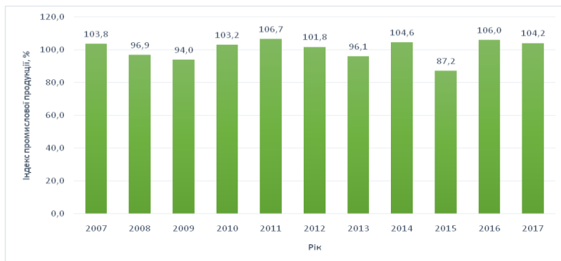
Рис.1. Динаміка індексів виробництва продукції харчової промисловості, 2007-2017 рр.

порівняно з 2010 (+6,7%), а найменший у 2015 році порівняно з 2014 роком ( -12,8%). З 2009 по 2011 рік відбувається поступове збільшення виробництва продукції харчової промисловості, а далі спад по 2013 рік.