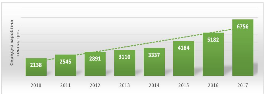
Рис. 5. Динаміка середньої заробітної плати працівників харчових підприємств, 2010-2017 рр.

На рис. 4 зображено динаміку середньої заробітної плати працівників, зайнятих у харчовій промисловості, а на рис. 5 проведено порівняння цього показника із загальним по Україні.