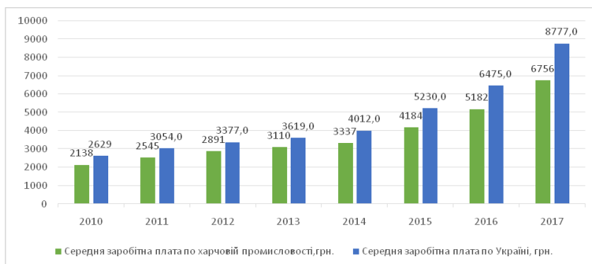
Рис.5. Середня заробітна плата працівників харчової промисловості та в цілому по Україні, 2010-2017 рр. [7, 8]

робітників на робочих місцях, виплати справедливої заробітної плати та соціальний захист робітників, усунення неробочого обладнання та технічний огляд машинного устаткування.